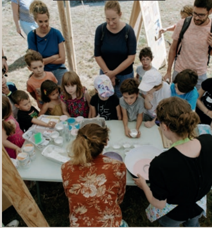
Exemple de projet mené par l'équipe Veduta au Grand Parc Miribel Jonage dans le cadre de la résidence de Nicolas Momein en 2019.

En pied d'immeuble, dans les Espaces verts, sur les places et même dans les deux médiathèques, l'art contemporain viendra à la rencontre des Fontainoises et des Fontainois en 2021.